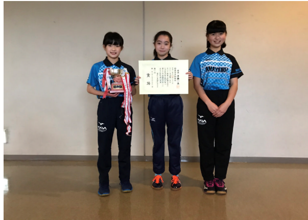
富久山卓球スポーツ少年団