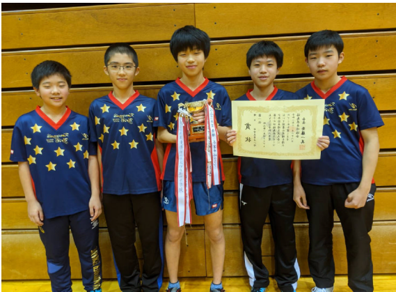
郡山第一卓球クラブスポーツ少年団