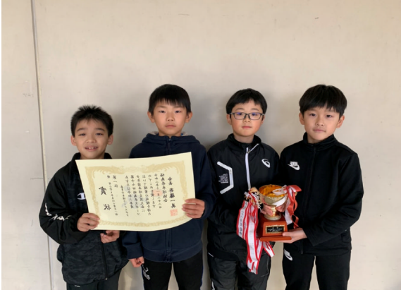
喜多方卓球ランドスポーツ少年団