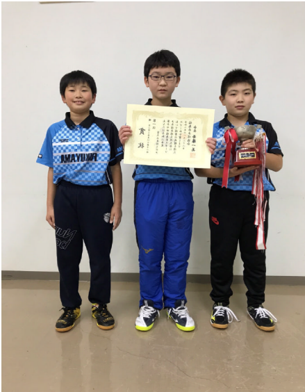
富久山卓球スポーツ少年団