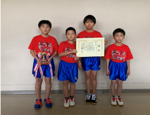
勿来卓球クラブスポーツ少年団