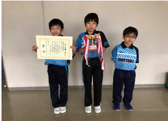
富久山卓球スポーツ少年団