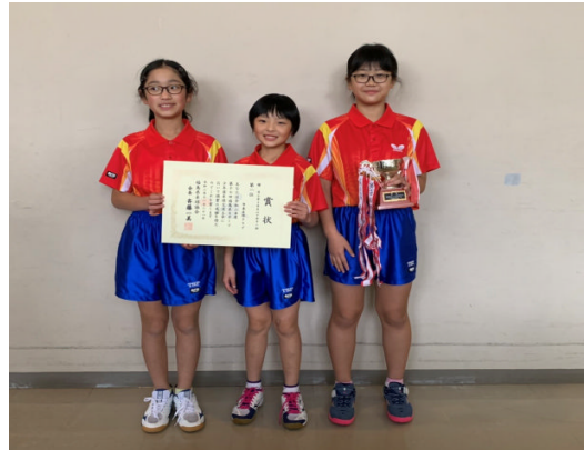
勿来卓球クラブスポーツ少年団