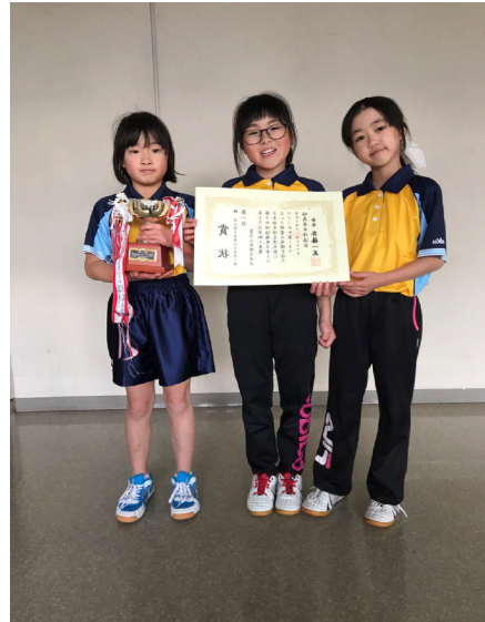
富久山卓球スポーツ少年団