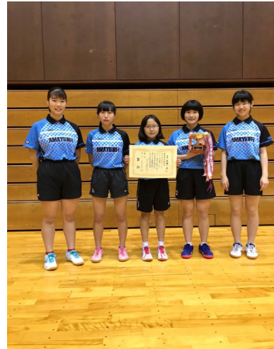
富久山卓球スポーツ少年団