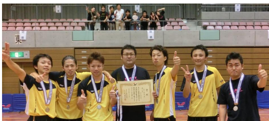
前年度全日本クラブ卓球選手権大会 男子2部 準優勝 GLORY